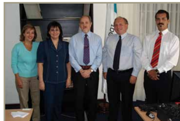
El equipo de la Oficina de Representación de Uruguay A equipa do Escritório de Representação do Uruguai