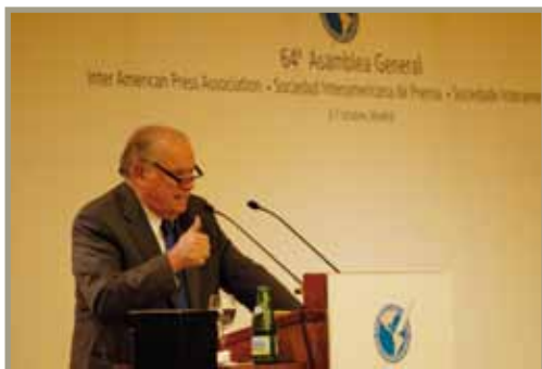
Enrique V. Iglesias en la Asamblea General de la Sociedad Interamericana de Prensa Enrique V. Iglesias na Assembleia-Geral da Sociedade Interamericana de Imprensa