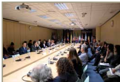
bid08 - Bienal Iberdiseño bid08 - Bienal Iberdiseño