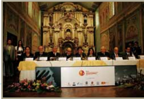
FIBEMYD Programa de acción sobre Migraciones, Cuenca (Ecuador) FIBEMYD Programa de acção sobre Migrações, Cuenca (Equador)