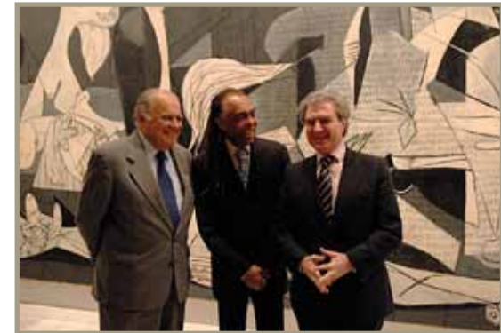
Ibermuseos. Enrique V. Iglesias con Gilberto Gil y César Antonio Molina Ibermuseus. Enrique V. Iglesias com Gilberto Gil e César Antonio Molina