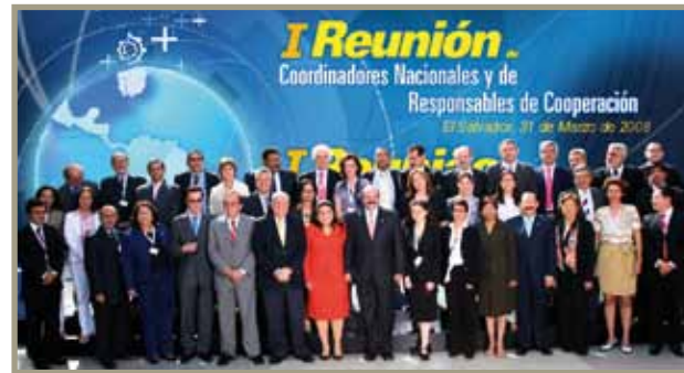
I Reunión de Coordinadores Nacionales y Responsables de Cooperación I Reunião de Coordenadores Nacionais e Responsáveis pela Cooperação