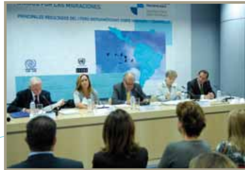
Resultados I Foro Iberoamericano sobre Migraciones Resultados I Fórum Ibero-Americano sobre Migrações