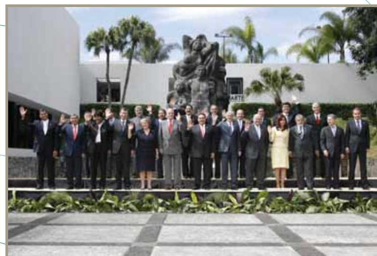
Foto de família XVIII Cumbre Iberoamericana, San Salvador Fotografia de família XVIII Cimeira Ibero-Americana, São Salvador