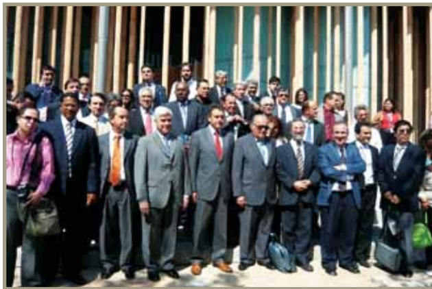
Reunión de los directores del Codia Reunião dos directores do Codia