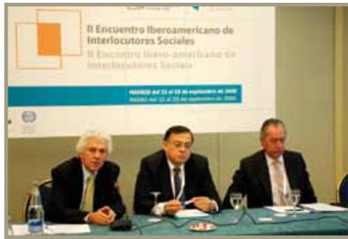
II Encuentro Iberoamericano de Interlocutores Sociales II Encontro Ibero-Americano de Interlocutores Sociais