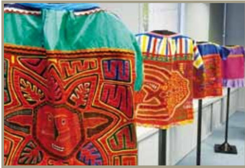
Exposición: El Arte de las Molas Exposição: A Arte das Molas