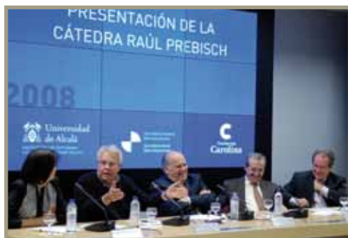
Presentación Cátedra Raúl Prebisch Apresentação Cátedra Raúl Prebisch