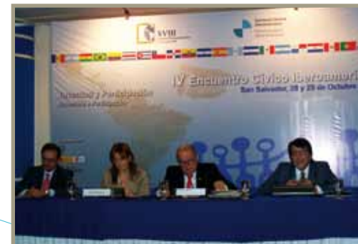
IV Encuentro Cívico Iberoamericano IV Encontro Cívico Ibero-Americano