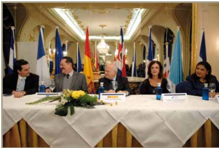
Encuentro América Central y Unión Europea Encontro América Central e União Europeia