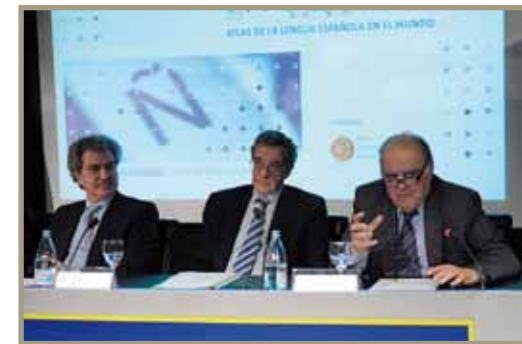
Presentación: Valor económico del Español Apresentação: Valor económico do Espanhol