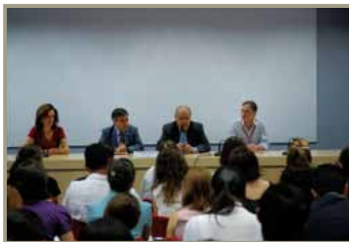
Jóvenes Líderes Iberoamericanos Jovens Líderes Ibero-Americanos