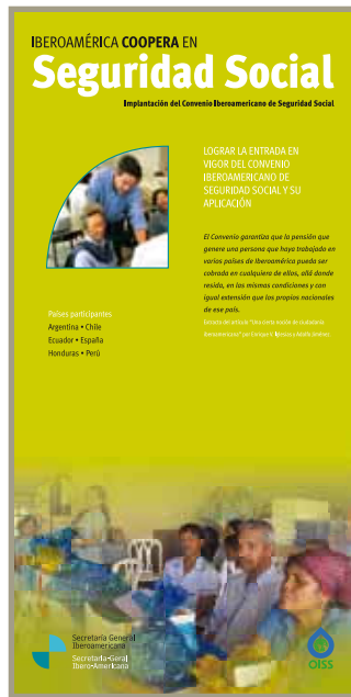
Panel Exposición Iberoamérica coopera. Painel Exposição Ibero-América Coopera