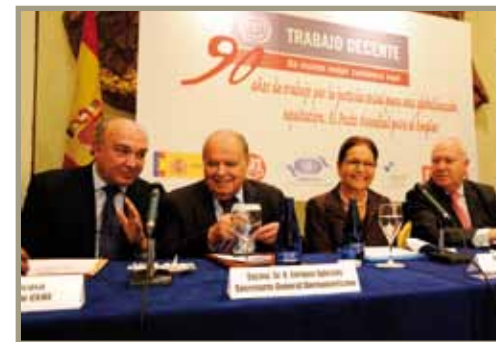
Acto conmemorativo de los 90 años de la OIT Cerimônia de comemoração dos 90 anos da OIT