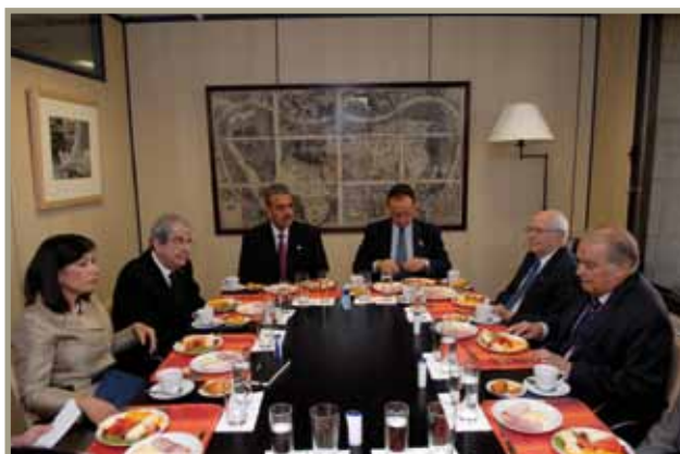
Desayuno de trabajo con Ana Vilma de Escobar y Rafael Espada, vicepresidentes de El Salvador y Guatemala Pequeno-almoço de trabalho com Ana Vilma de Escobar e Rafael Espada, Vice-presidentes de El Salvador e Guatemala