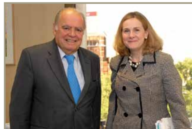
Enrique V. Iglesias con Pamela Cox, Vicepresidenta del Banco Mundial Enrique V. Iglesias com Pamela Cox, Vice-presidente do Banco Mundial