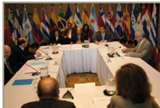
Traspaso Secretaría Pro-Tempore de Chile a El Salvador Transferência da Secretaria Pro-Tempore do Chile para El Salvador