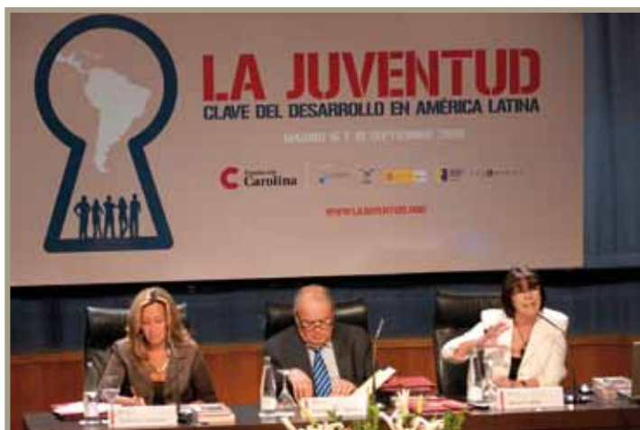
Juventud y desarrollo Juventude e desenvolvimento