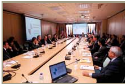
Jornada sobre los Bicentenarios Jornada sobre os Bicentenários