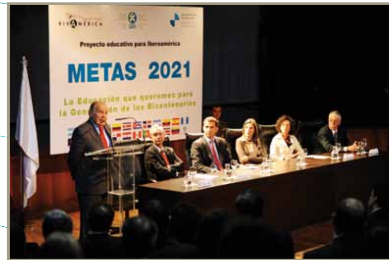
Proyecto Educativo para Iberoamérica Projecto Educativo para a Ibero-América