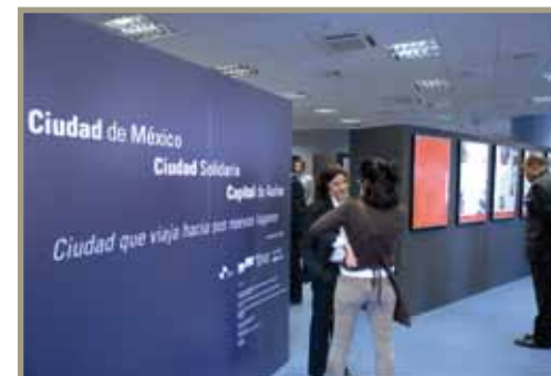
Exposición: Mexico, Ciudad de Asilos, Ciudad Solidaria Exposição: México, Cidade de Asilos, Cidade Solidária