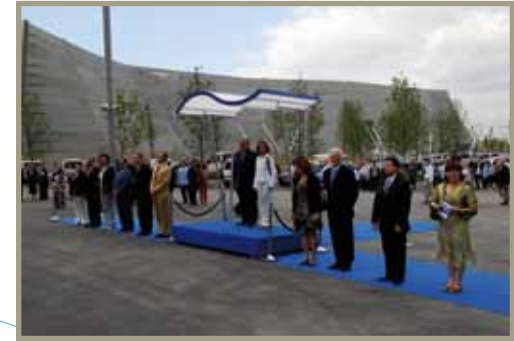
La SEGIB en la Expo de Zaragoza A SEGIB na Expo de Saragoça