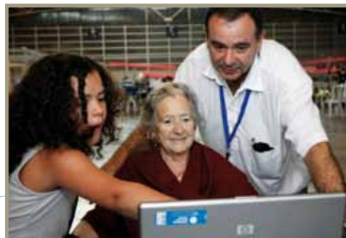
Campus Party Iberoamérica Campus Party Iberoamérica