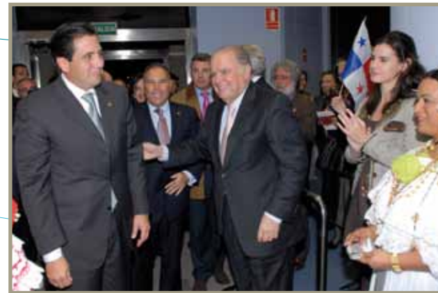
Enrique V. Iglesias con Martín Torrijos, presidente de Panamá, en la inauguración de la exposición El Arte de las Molas Enrique V. Iglesias com Martín Torrijos, presidente do Panamá, na inauguração da Exposição A Arte das Molas