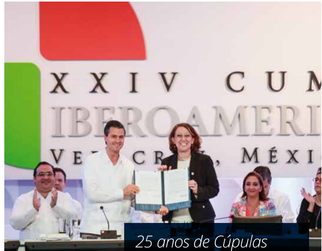
XXIV Cúpula Ibero-Americana. México, 2014.

Desde então e até 2014 realizaram-se vinte e quatro Cúpulas anuais, nas quais todos os países estiveram representados ao mais alto nível. Este facto, por si só, reflete a importância da iniciativa. Nos vinte e cinco anos decorridos desde então, construiu-se um importante acervo institucional e uma poderosa plataforma de Cooperação.