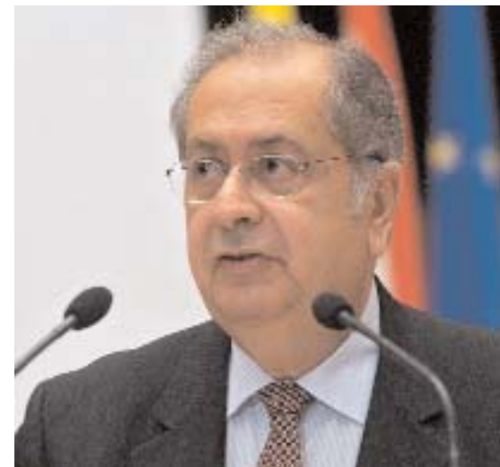
José Sócrates, primer ministro portugués, sobre estas líneas, y Jaime Gama, presidente de la Asamblea Nacional portuguesa, a la derecha.

El Secretario General Iberoamericano insistió en la necesidad de que la Innovación y el Conocimiento (temas centrales de la Cumbre Iberoamericana de Jefes de Estado y de Gobierno) sean los verdaderos motores del desarrollo: "los iberoamericanos