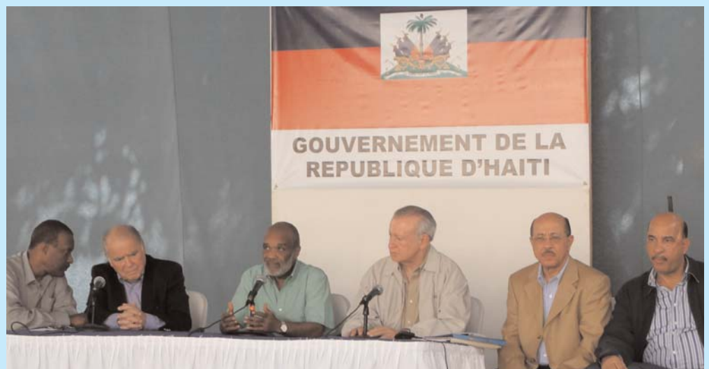
Enrique V. Iglesias, con el presidente de Haití, René Preval, y miembros de la Delegación de la República Dominicana que lo acompañó.

Asimismo, deseo que este querido país se acerque aún más, coopere aún más, con los países de la Conferencia Iberoamericana. Hermana Haití, hermanos haitianos, sois parte de nuestra familia en los momentos de duelo y en la búsqueda, entre todos, de un prometedor futuro. □