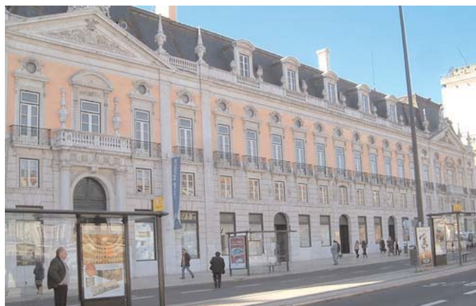
Fachada principal del Palacio Foz, en la capital lisboeta

Este foro es uno de los encuentros previos a la Cumbre Iberoamericana de Jefes de Estado y de Gobierno que se celebró en la localidad lusa de Estoril y cuyo tema central fue "Innovación y conocimiento".