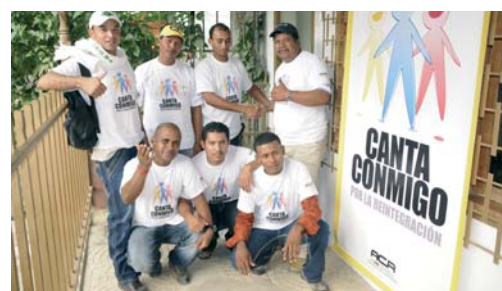
Participantes en el programa fotografiados en el municipio de Apartado (Antioquia) durante una gira que hicieron por Colombia.

Estos jóvenes hoy componen canciones para expresar su propia historia, sus sueños de