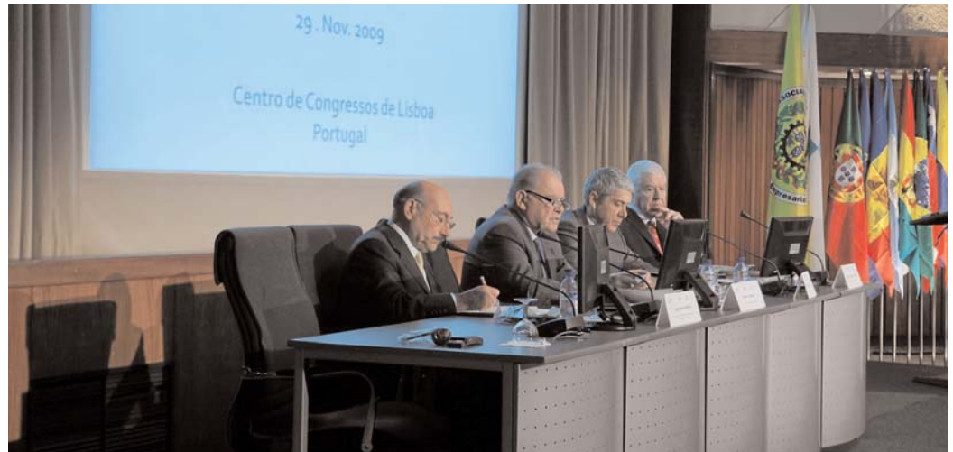
La reunión tuvo lugar en el Centro de Congresos de Lisboa y contó con la presencia del primer ministro portugués.

► Incorporar al sector empresarial en los esfuerzos de los gobiernos para aumentar y mejorar la enseñanza secundaria y la universitaria en los países de América