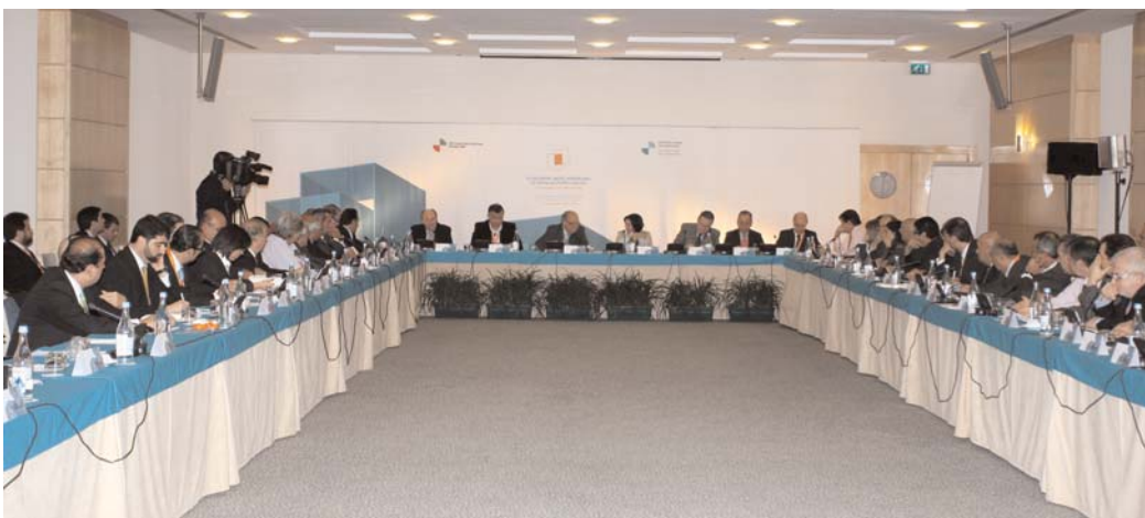
Mesa presidencial con la ministra portuguesa de Trabajo, el Secretario General Iberoamericano y algunos de los representantes de los sindicatos.

E l III Encuentro Iberoamericano de Interlocutores Sociales fue inaugurado el 24 de noviembre en Lisboa con presencia de la Ministra portuguesa de Trabajo y Seguridad Social, Helena André, y el Secretario General Iberoamericano, Enrique V. Iglesias. Este Encuentro formó parte de los foros de debate previos a la XIX Cumbre