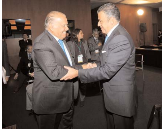
Dos momentos de los cordiales saludos entre el Secretario General Iberoamericano y asistentes a la reunión.

La Secretaría de Relaciones Exteriores (SRE) celebró el 7 y 8 de enero la XXI Reunión de Embajadores y Cónsules de México, a la que asistieron más de noventa titulares de diversas representaciones de nuestro país