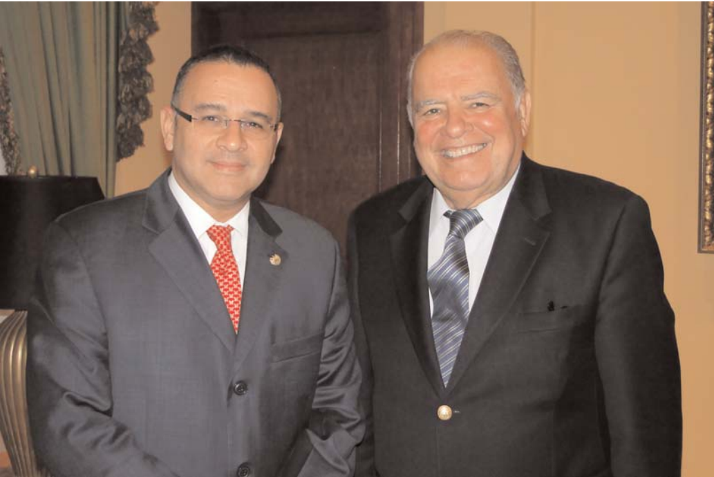
A la izquierda, el presidente de El Salvador, Mauricio Funes, con Enrique V. Iglesias.

ron temas de interés regional como la crisis financiera mundial y sus efectos en El Salvador y el resto de Centro América; sostenibilidad democrática en la región, seguridad ciudadana, avances en proyectos sociales y programas encaminados a fortalecer a los sectores más vulnerables de las sociedades del área.