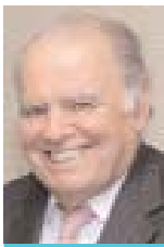
Enrique V. Iglesias Secretario General Iberoamericano