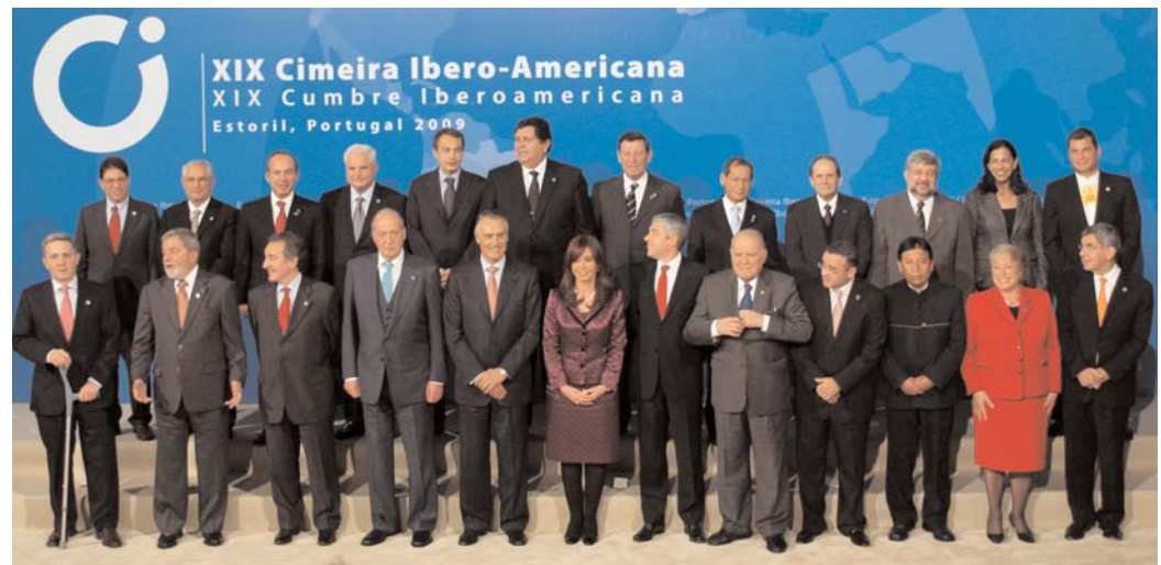
Foto de familia de los mandatarios iberoamericanos presentes en la cumbre de Estoril