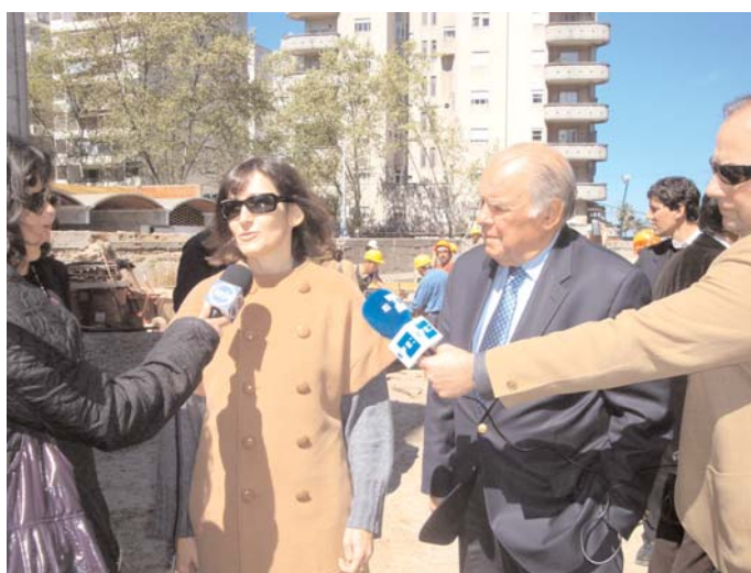
La ministra española de Cultura, Ángeles González-Sinde contesta a las preguntas de los periodistas durante su visita a las obras de construcción del Complejo Cultural García Lorca.

Posteriormente, afirmó que la cooperación en esta área es prioritaria, por la trascendencia que tiene el desarrollo cultural en sí mismo, y como generador de actividades y empleo.