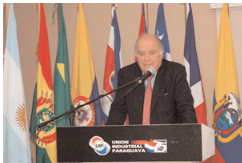
Enrique V. Iglesias durante su intervención en el acto de inauguración.

El Vicepresidente paraguayo se refirió a la Cumbre como “una buena oportunidad para poner en la vidriera a Paraguay”, ofreció a los inversores un país con la mayor producción de