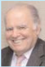
Enrique V. Iglesias