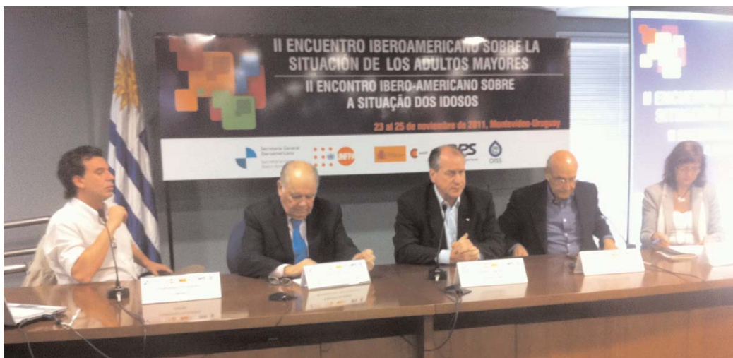
Dos momentos del II Encuentro Iberoamericano sobre la situación de los adultos mayores.