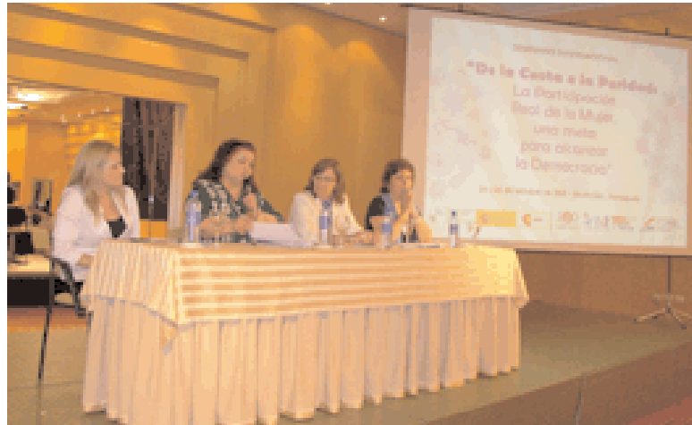
A la izquierda, mesa presidencial del Seminario. Abajo, Dilma Rousseff, Cristina Kichtner y Laura Chinchilla, tres ejemplos de liderazgo femenino en Latinoamérica