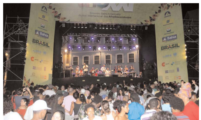
Arriba, acto de apertura de AFROXXI, en el Centro de Convenciones de Salvador de Bahía. Interviene Jaques Wagner, Gobernador del Estado de Bahía.

A partir de AfroXXI, tenemos la oportunidad de ampliar y profundizar este proceso en todo el ámbito iberoamericano. Los dos documentos producidos en el evento; la Carta de Salvador, y la Declaración de Salvador aprobada por Jefes de Estado y representantes de países, son testimonio