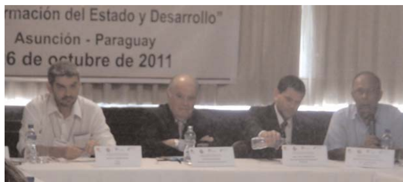
Mesa presidencial del II Encuentro Sindical Iberoamericano.