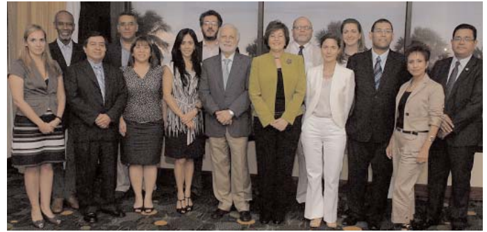
Foto de familia de los participantes en la reunión