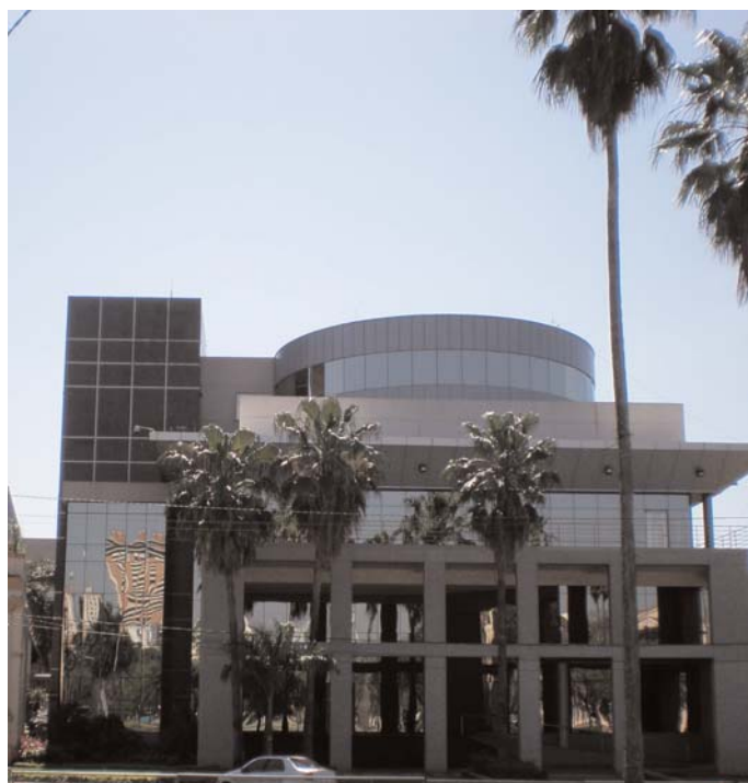
Sede del Parlamento Nacional en Asunción