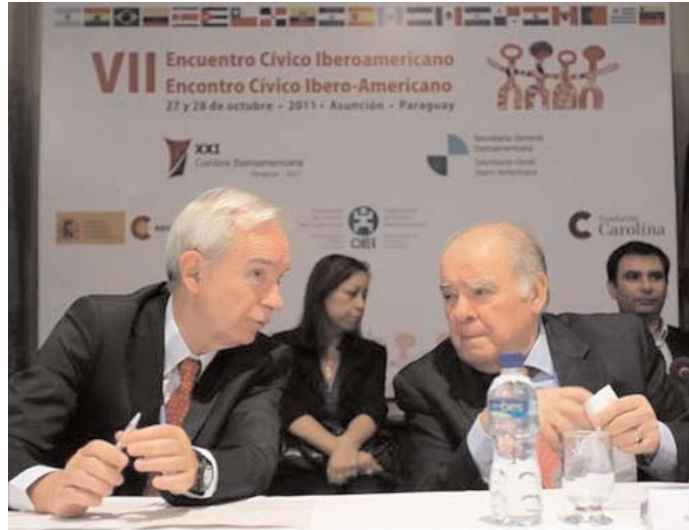
Álvaro Marchesi, Secretario General de la OEI, con Enrique V. Iglesias.

La agenda de trabajo se estructuró en torno a tres temas principales: Incidencia y Participación de la sociedad civil en políticas públicas con perspectivas de derechos enfocados en la transformación del Estado y Desarrollo; a las Nuevas perspectivas de la cooperación internacional en su aporte para la transformación del Estado y el Desarrollo, y en el derecho