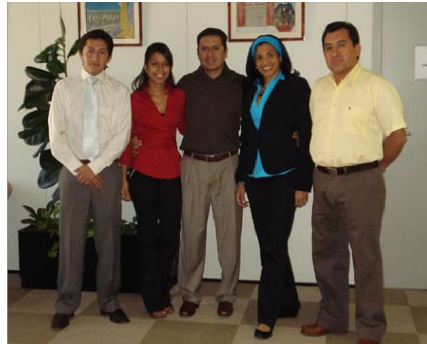
Examinadores de patentes (2008).

Gasto ejecutado: El gasto ejecutado en el 2008 es 132.272 euros.