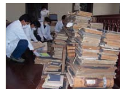
Puesta en valor del Archivo Histórico-Militar Nacional (Perú) PRIMERA FASE: Inventario y conservación del fondo documental del Ministerio de Guerra y Marina 1821-1919. Digitalización de documentos correspondientes al proceso de Independencia 1821-1824.