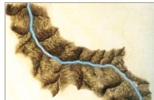
Río Usumacinta. Para entender la historia de la frontera entre Belice, Guatemala y México se debe analizar los procesos históricos en ambos márgenes de los ríos Hondo, Suchiate y Usumacinta.

Gasto ejecutado: El total de gasto ejecutado en el 2008 es de 50.381 euros .