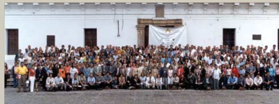
VII Congreso Iberoamericano de Municipalistas. Guatemala.

Gasto ejecutado: El gasto total ejecutado es de 869.785 euros.