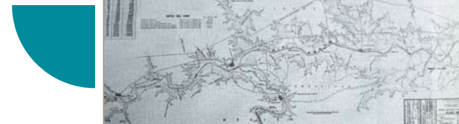
Presas en fronteras. Plano de la cortina de la presa Falcón, ubicada curso abajo del Río Bravo, en la frontera entre Estados Unidos y México.