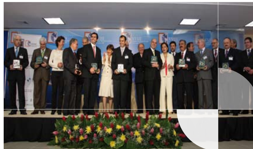
Entrega de los VIII Premios Iberoamericanos de Calidad, en la Cumbre del Salvador (2008).

Gasto ejecutado: El gasto total ejecutado en el 2008 es de 487.756 euros .