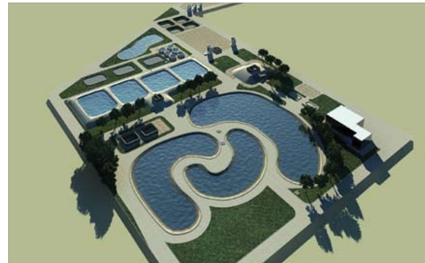
Centro de experimentación y formación en tratamientos no convencionales de depuración de agua. (Canelones, Uruguay).

El gasto total ejecutado durante el 2008 es de 41.200 euros .