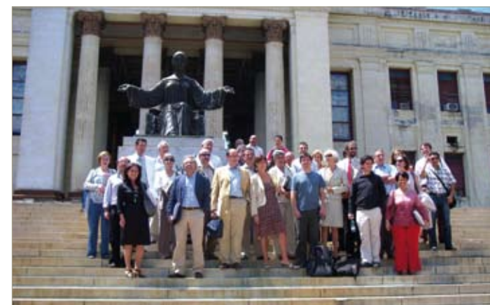
Reunión técnica celebrada en La Habana del 24 al 27 de marzo DE 2009. En ella se reunieron los directores de los programas de doctorado seleccionados por los países

El coste del programa es 800.000 euros (1º año) a ejecutar a partir del 2009.