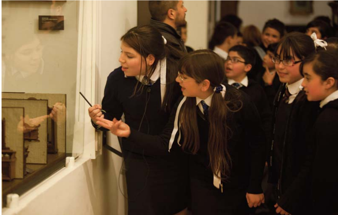
Estudiantes en el Museo Histórico Nacional, 2011.

Examinaremos una iniciativa que, si bien se enmarca en una política pública nacional y transnacional, se activa y recrea a pequeña escala de un modo singular.