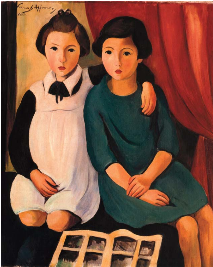
Museu Nacional de Arte Contemporânea - Museu do Chiado. N.º Inv. 1525. Meninas (1928), de Sarah Affonso.

femininos, referidos como envolvimentos apaixonados e pormenores sensíveis, considerando «a sua força plástica, o seu pessoalismo» (Serrão, 2013: 33). Inspira-se em obras de seu pai e numa coleção de obras de artistas da Andaluzia que teria em casa, com pinturas na linha de Zurbaran, mas certamente se encantara com as pinturas de André Reinoso, na Misericórdia de Óbidos (1629) longe das fórmulas maneiristas ao explorar «uma nova “construção” do espaço segundo cânones tenebristas, com desenho “ao natural”, modelação luminosa, no gosto do Barroco peninsular» (Serrão, 2013: 32). Excelente miniaturista, Josefa d’Óbidos aceitou encomendas religiosas transmitindo