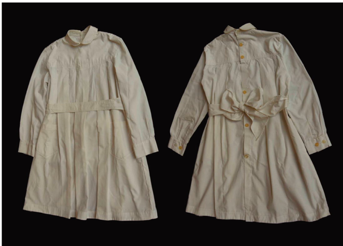
Túnica de niña de Escuela Pública (década del 70, siglo xx). Frente y dorso.

el sainete de Pepino el 88 . Este retrataba a los guapos del barrio del Cordón como: «gente de pelo en pecho/con quien hay que andar derecho pues no es manco pa'el facón/es de muy mala intención». Agregaba que, «Aquí en Montevideo/son los taitas majaderos del compadraje oriental/ porque se ha hecho general/entre los de rompe y raja la camiseta y la faja/la más chillona golilla/ pues hasta usan gran cuchilla que de dos cuartas no baja» (Podestá. J. s/f: 62-63).