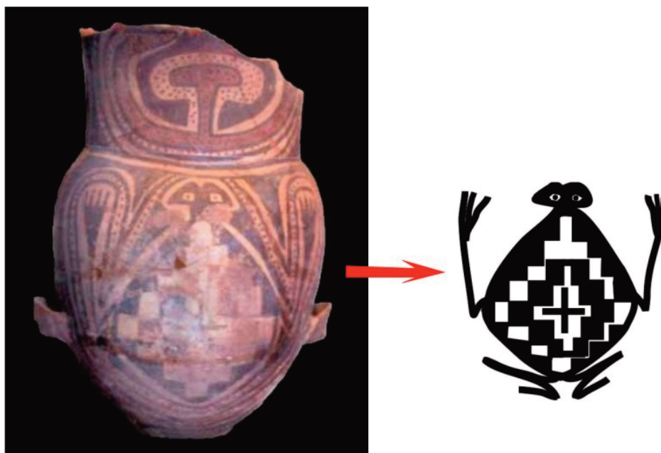
Figura 1. Alfarería de estilo Santamariano (Noroeste Argentino, Período Tardío: 900-1480 AD). Izquierda: urna con representación de batracio, pintura negro y rojo sobre blanco (modificada de Nastri y Stern Gelman, 2011: 32, figura 5); derecha: detalle esquemático del motivo del batracio. Derechos: Boletín del Museo Chileno de Arte Precolombino. Santiago, Chile.

Algunos autores del siglo XIX han interpretado a ciertas imágenes figurativas plasmadas en el arte rupestre o en esculturas en piedra como representaciones de la divinidad (Quiroga, 1992 [1931]). Se ha propuesto también que las imágenes de batracios, presentes en el repertorio de motivos pintados en urnas funerarias del denominado estilo Santamariano de la zona de los Valles Calchaquíes, habrían sido una manifestación visual de la Pachamama 1 (Mariscotti de Görlitz, 1978; Nastri, 2009). Estos sapos ocupan todo el cuerpo de vasijas (figura 1) empleadas como contenedores de restos mortales de niños para su entierro. En el NOA existe una milenaria tradición prehispánica de utilizar reci-