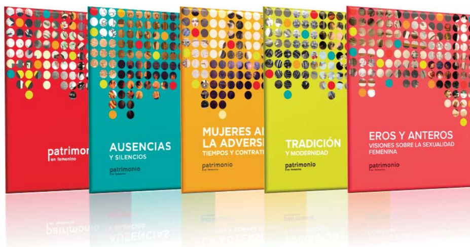
Portadas de las publicaciones electrónicas de las cinco primeras ediciones del proyecto «Patrimonio en Femenino».

Finalmente, al estudiar los bienes culturales presentes en la primera edición, observamos la ausencia de obras que representaran o se asociaran al sexo masculino. Nos planteamos el propósito inverso: a través de las obras en las que se representaban hombres, inducir al análisis de aquellos ámbitos de la vida pública, e incluso, privada, en la que las mujeres han estado ausentes o bien, estando presentes, no han sido tenidas en cuenta o fueron silenciadas por los discursos historiográficos y antropológicos que se han venido