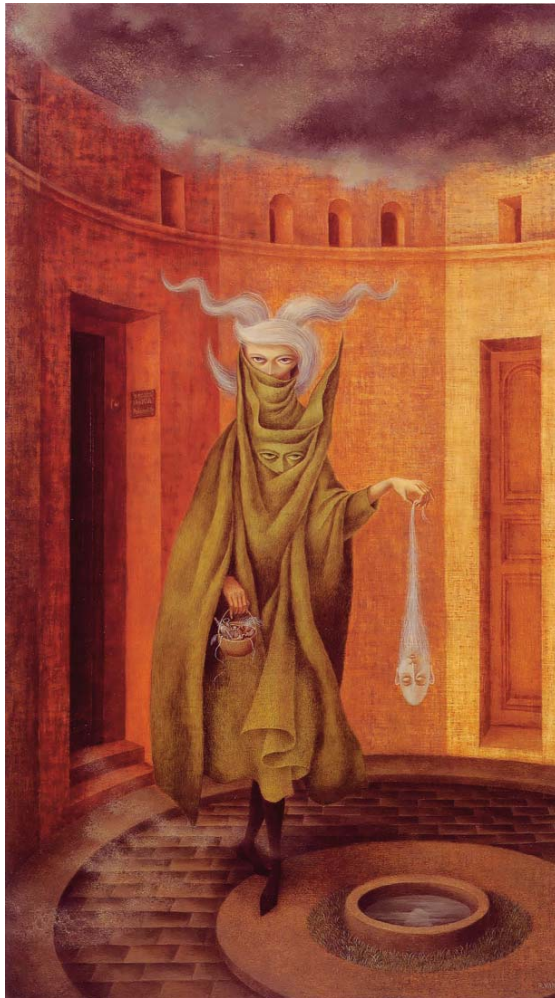
Instituto Nacional de Bellas Artes de México. SIGROPAM: 29541. Mujer saliendo del psicoanalista (podría ser Juliana) (1960), de Remedios Varo.

A partir del movimiento feminista, que ha dejado importantes huellas no solo en el campo político y social, sino también en el cultural, en los últimos años, el número de las