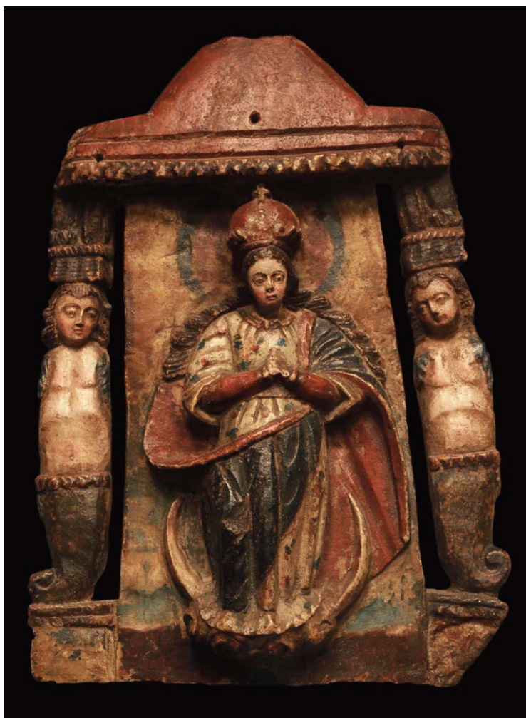
Figura 2. Inmaculada Concepción con sirenas, tallada y policromada en piedra de Huamanga. Anónimo, siglo XVIII, Huamanga (Perú). Colección del Museo de Arte Hispanoamericano Isaac Fernández Blanco, Gobierno de la Ciudad Autónoma de Buenos Aires.

dades telúricas más allá del recurso plástico empleado; las piezas artísticas coloniales ofrecen entonces una nueva versión visual de la Pachamama, producto de una tradición estética diferente, ahora como representación figurativa antropomorfa, y más aún, como figura humana y femenina. En este sentido, podemos encontrar también manifestaciones de imaginería mariana, como es el caso de la piedra de Huamanga tallada con la imagen de la Inmaculada Concepción de la Virgen, la cual algunos suelen emparentar con la Virgen de Copacabana (figura 2). Esta pieza anónima del siglo XVIII se puede observar hoy en día en el Museo de Arte Hispanoamericano Isaac Fernández Blanco, de la Ciudad Autónoma de Buenos Aires.