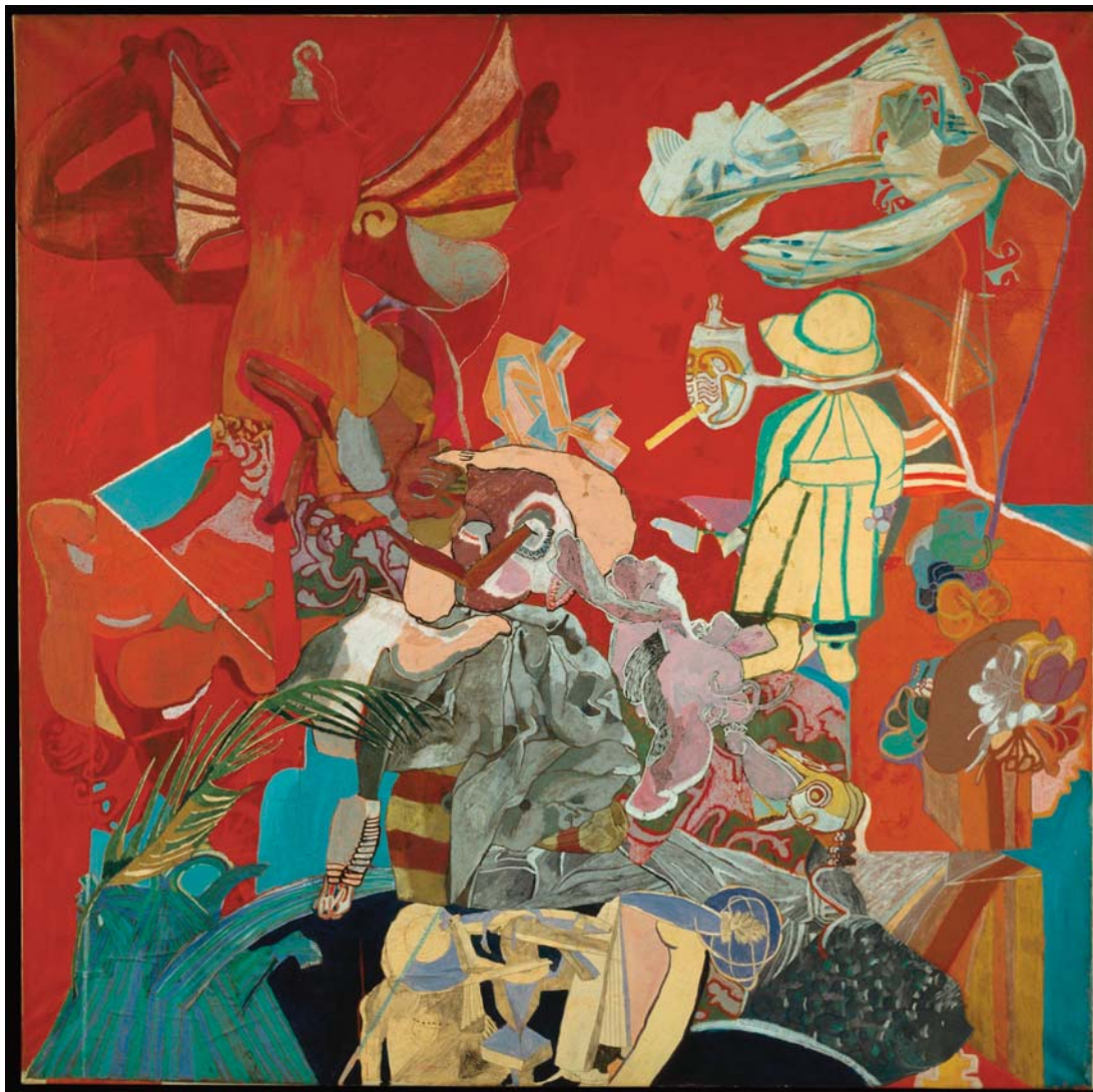
Museu Nacional de Arte Contemporânea - Museu do Chiado. N.º Inv. 2009. Self portrait in red [Auto-retrato] (1953), de Paula Rego.

reflete inicialmente numa pintura em mancha mas que aos poucos se desvanece em linhas puras. As suas obras aproximam-se de trabalhos naïf franceses, numa interpretação única das memórias de infância no Minho e de um imaginário popular. Apesar do seu fascínio pela produção e figura de Almada Negreiros, com quem casaria em 1934, teima