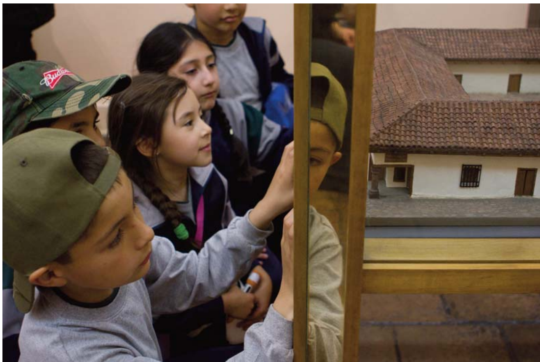
Estudiantes en el Museo Histórico Nacional, 2011.

Los cruces entre género y patrimonio conectan conceptos que tienen en común referirse a «lo construido social y simbólicamente» y, no obstante, situarse en aquel paradójico terreno de la consagración de «esencias» naturalizadas, aquello que pudiera nombrarse como «lo dado». Ser hombre y ser mujer han sido identidades narradas como piezas en un ensamble binario, alineadas con el diseño de una historia monolítica. Pensar la diferencia sexual desde el patrimonio, donde lo masculino es lo neutro-universal y lo femenino se omite y mimetiza con este discurso único, no es sólo una cuestión de sumatoria de nuevos elementos a los ya existentes. Examinar rigurosamente el asunto, implicaría desafiar toda la tradición del pensamiento ilustrado occidental que en las instituciones