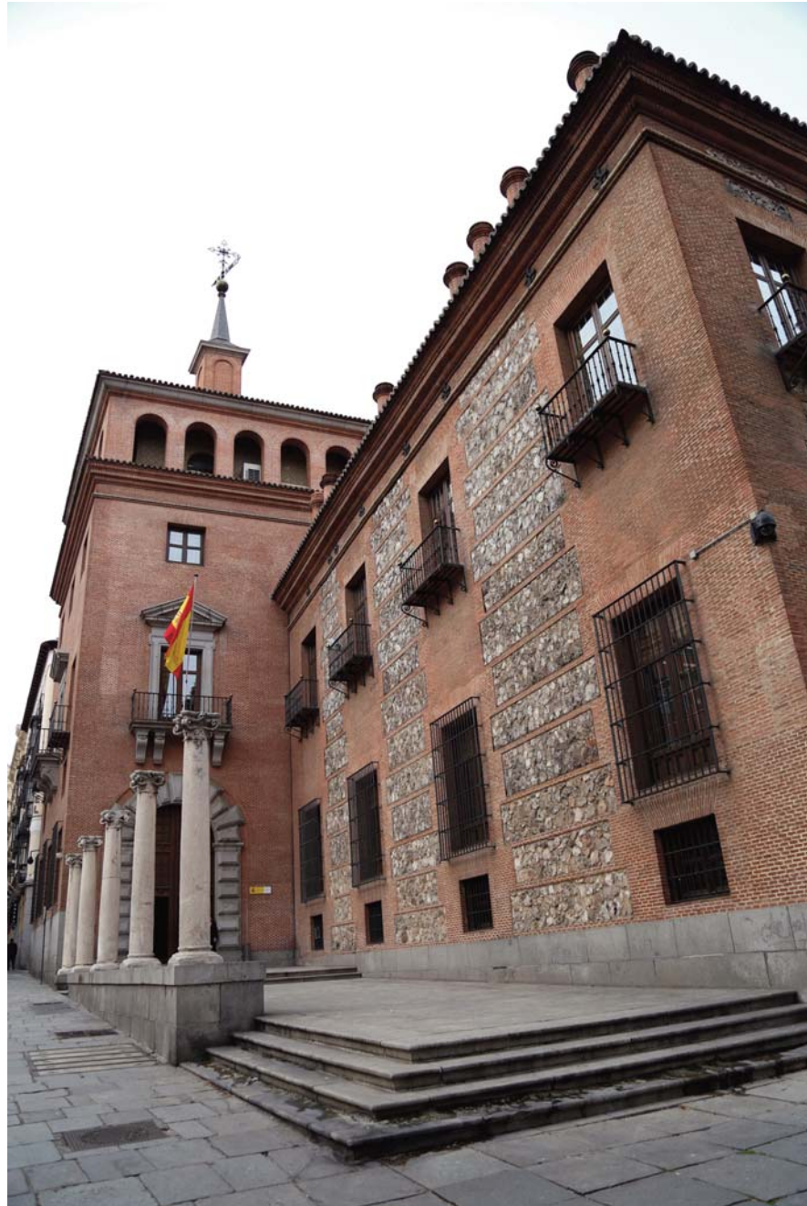
Sede de la Secretaría de Estado de Cultura. Fotografía: Javier Rodríguez Barrera. Ministerio de Educación, Cultura y Deporte.