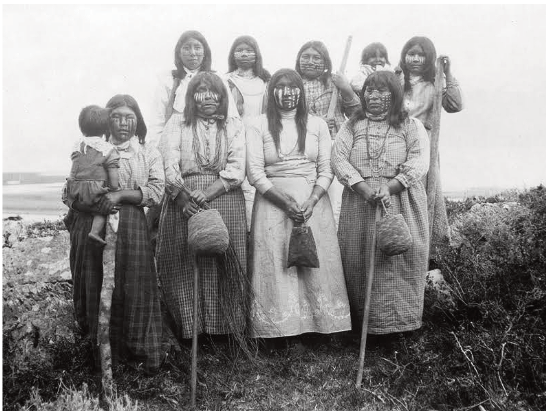
Mujeres del pueblo yagán en Puerto Remolino. Museo Antropológico Martin Gusinde. Martin Gusinde, 1919. Gentileza Anthopos Institut.

Para el Estado chileno, el extremo austral del continente y sus habitantes no habían sido objeto de mayor interés, incluso había sido llamado como «la tierra maldita».