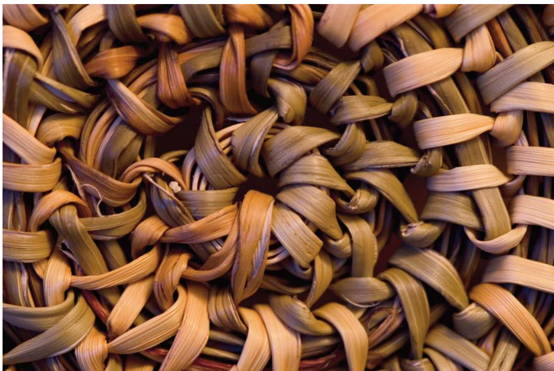
Detalle tejido en junco. Museo Antropológico Martin Gusinde. Luis Berteá, 2004.

Hace por lo menos 6000 años AP, grupos canoeros habitaron el extremo austral de América, al primer contacto que tuvieron con exploradores europeos las familias se distribuían hasta el Cabo de Hornos.