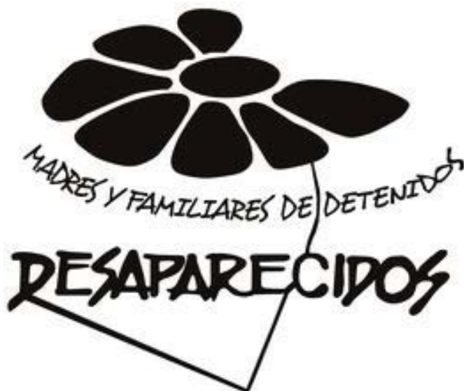
Distintivo de la organización «Madres y Familiares de detenidos desaparecidos» de Uruguay.

Generizar el patrimonio es poner en evidencia la organización de la sociedad en contextos específicos e históricos problematizando los mandatos atribuidos a los sujetos en virtud de sus condiciones sexo-genéricas y destacando la excepcionalidad cuando ésta emerge, excepcionalidad que también refuerza el mandato, en tanto surge como tal en términos de desvío con respecto a estos lugares socialmente asignados. Es Delmira «deseando» en lugar de «ser deseada», como marcaba el mandato de sumisión femenina en relación a la sexualidad; son las «madres» politizando su condición y rompiendo con las barreras que separan lo privado (la familia, la reproducción) de lo público pero también mostrando que la condición de «madre» es un anclaje socialmente aceptado para denunciar el terrorismo de estado (Jelin, 2010) 1 ; es Vanni, desarrollándose profesionalmente en un campo masculino.