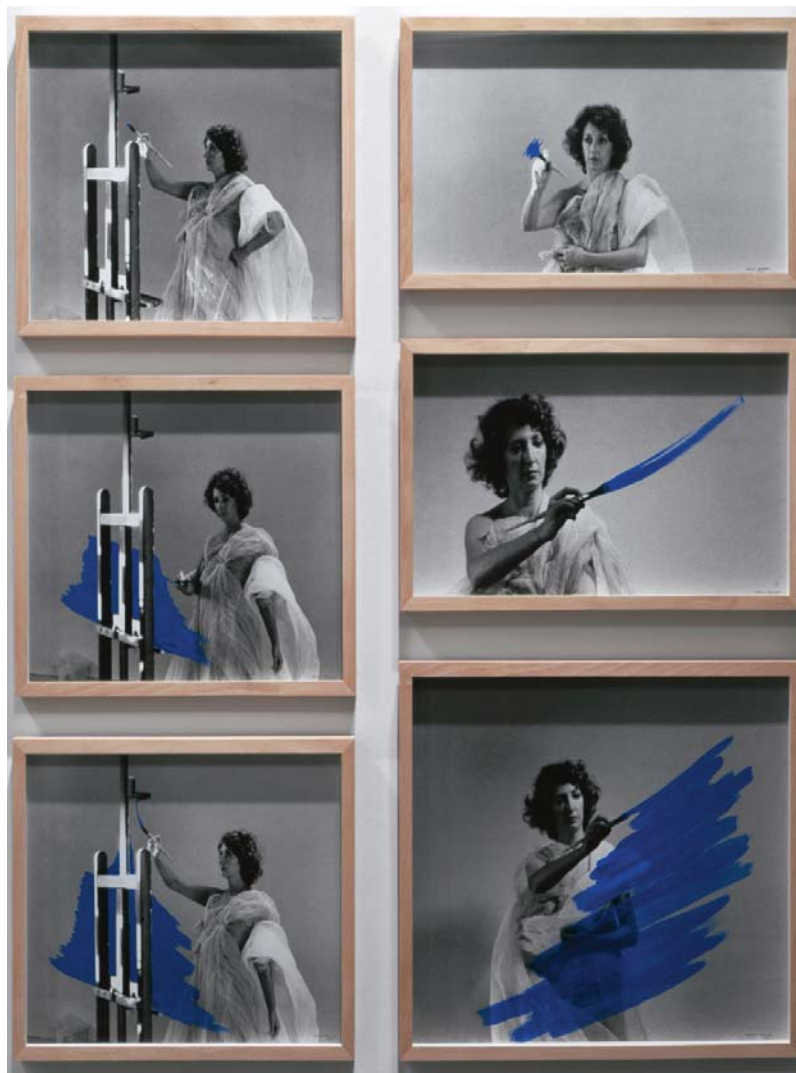
Museu Nacional de Arte Contemporânea - Museu do Chiado. N.º Inv. 2597. Pintura habitada (1974), de Helena Almeida.

crítico de arte Monteiro Ramalho, decorada com obras dos mais modernos jovens artistas frequentadores, por iniciativa e encomenda do proprietário.