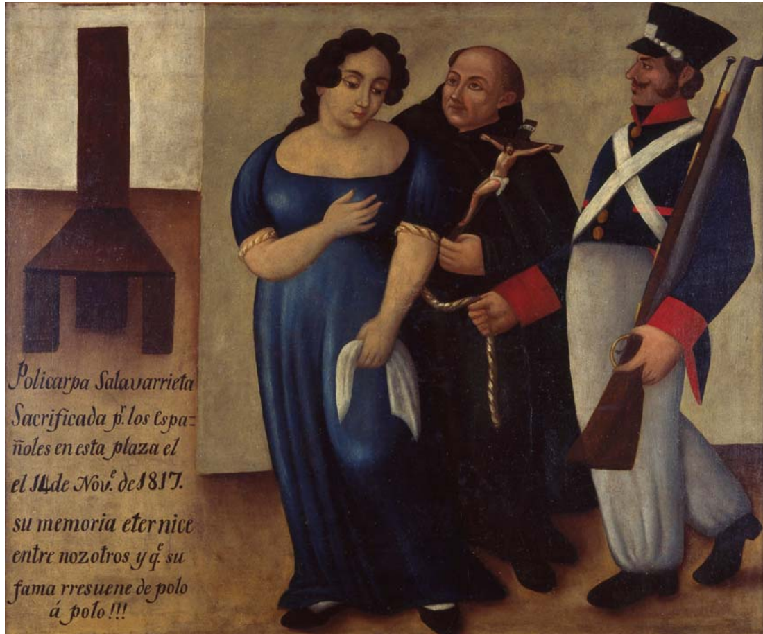
Museo Nacional de Colombia, reg. 555. Policarpa Salavarrieta marcha al suplicio (ca. 1825), de autor anónimo.

especializados en el área. Asimismo, esa investigación que se ha convertido en una muestra itinerante de carácter físico, presenta un formato similar a la propuesta virtual de la memoria femenina, y que igualmente se conecta con las inquietudes planteadas por La memoria femenina , como los temas de los derechos y la igualdad, en contraste con aspectos como los símbolos y mitos en torno a lo femenino. La muestra colombiana explora, entre otros temas, algunas obras de artistas colombianas, modernas y contemporáneas, que se han interesado en plantear sus obras a partir de una perspectiva de género, y establece diálogos entre todas ellas al entrecruzar sus aportes en el tiempo.