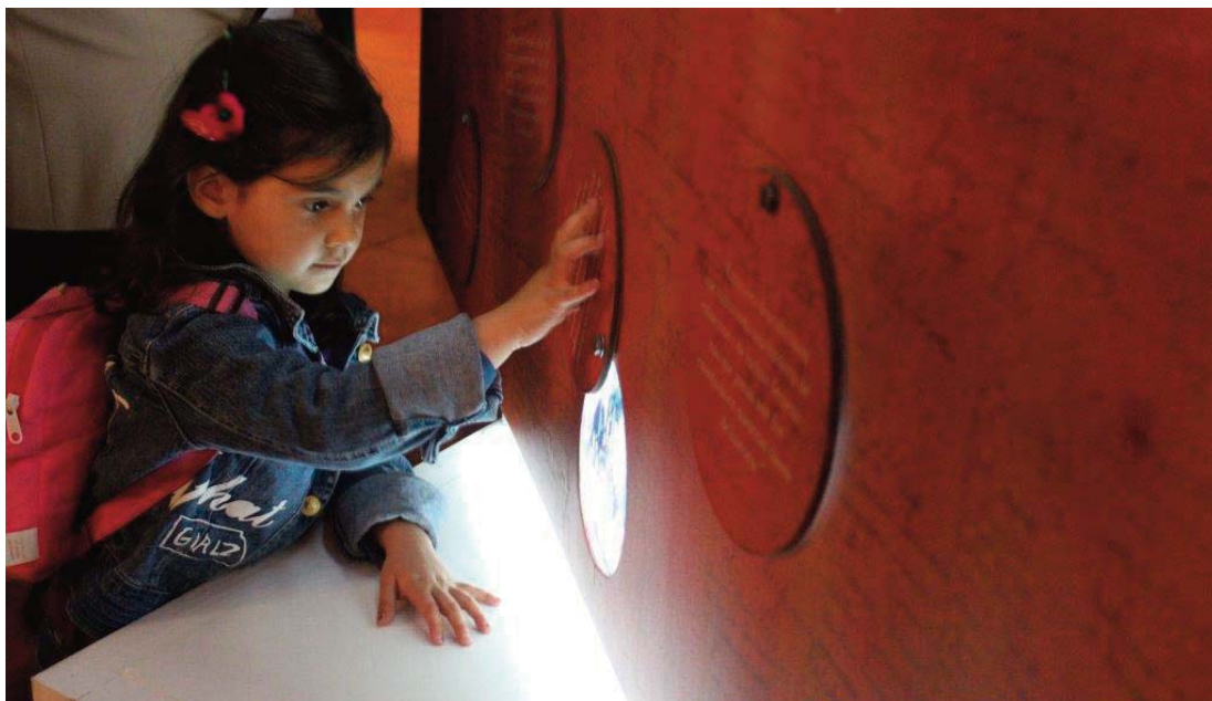
Niña en la exposición «Mujeres del Siglo XX», 2012.