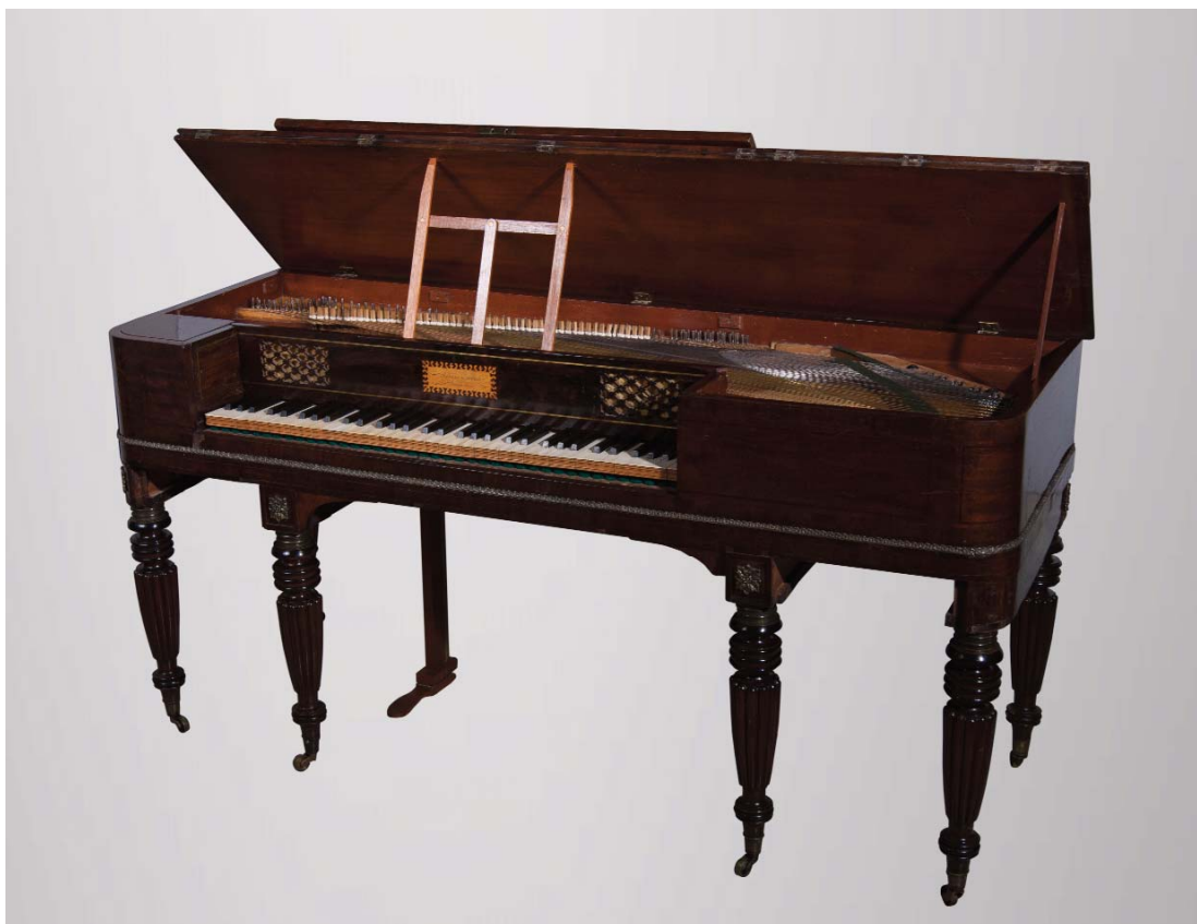
Pianoforte perteneciente a Mariquita Sánchez de Thompson en el que se ejecutó por primera vez el Himno Nacional, Museo Histórico Nacional, Argentina.

El día 8 de marzo de cada año conmemoramos la lucha de las mujeres por la igualdad social y política.