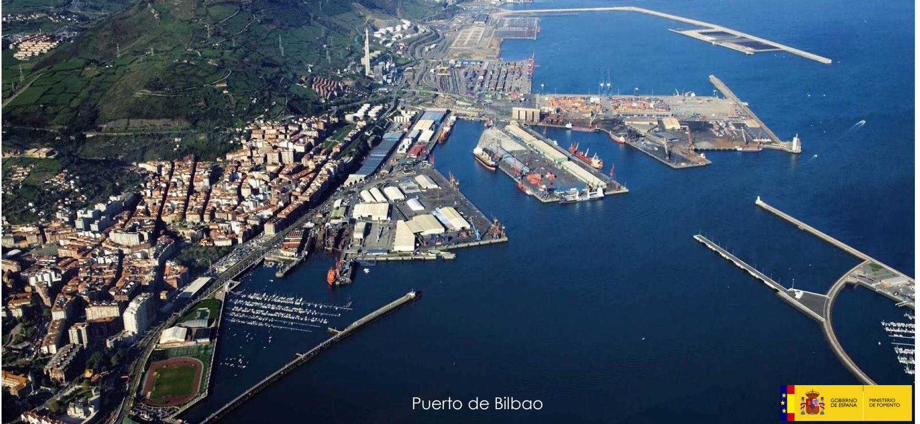
Puerto de Bilbao

Las exportaciones por vía marítima han registrado un incremento del 10% al cierre del primer semestre de este año