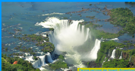
Paisaje inmaterial: Montañas de Guadalupe