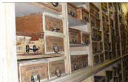
Visita al Archivo Diplomático del Ministerio de los Asuntos Extranjeros de Portugal.