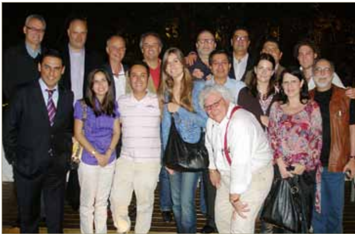
I Encuentro - Taller de Coproducciones de las Televisiones integradas en el Programa

El gasto total ejecutado en 2009 es de 1.276.270 euros.