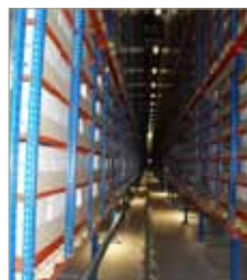
Visita al Centro de Almacenamiento de Documentos Administrativos. 22 de octubre de 2009. Las Rozas, Madrid, España.