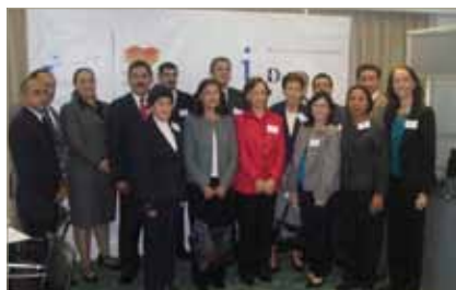
Inauguración de la XI Reunión de los representantes ante la Red de Archivos Diplomáticos Iberoamericanos. 19 de octubre de 2009. Lisboa, Portugal.

El gasto total ejecutado en 2009 es de 2.000 euros.