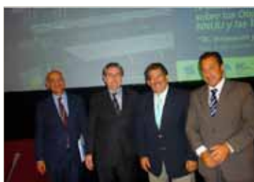
Innovación y Conocimiento