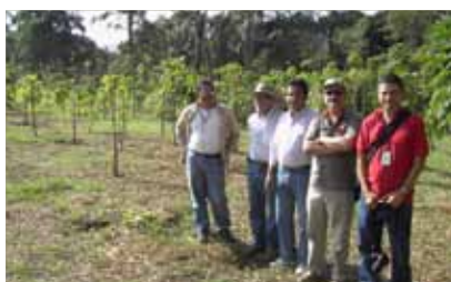
MOVILIDAD " Red Agroforestal y Alimentaria Iberoamericana (AGROFORALIA)" Universidad Origen: Universidad de Lleida Universidad Destino: Universidad Nacional de Colombia - Sede Medellín

http://www.espaciodelconocimiento.org/neruda/