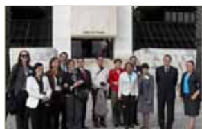
Visita al Archivo Nacional de Portugal "Torre do Tombo".