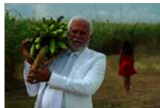
LA HIJA NATURAL dir. Leticia Tonos. Rep. Dominicana / Puerto Rico. En postproducción.

http://www.programaibermedia.com/langes/index.php