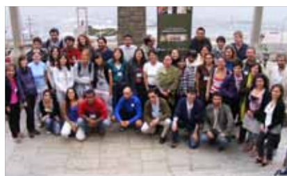
CURSO INTERNACIONAL DE POSTGRADO "AVANCES EN GENÓMICA FUNCIONAL" RIABIN del 11 al 22 de enero de 2010 en Valparaíso y Quintay, Chile

El gasto total ejecutado en 2009 es de 1.296.000 euros.