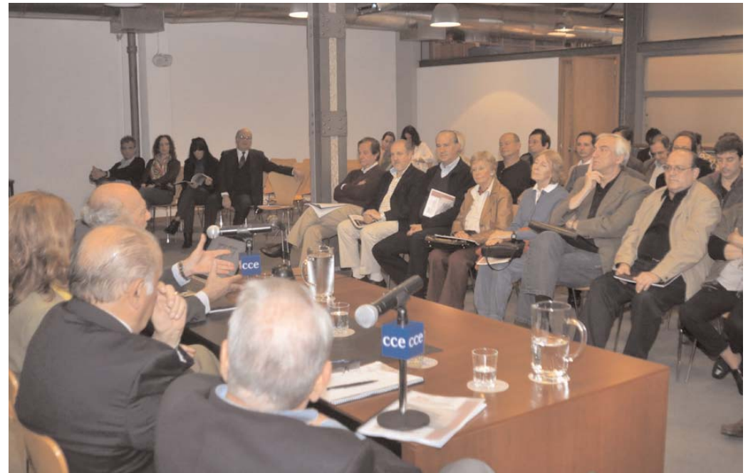
Panel que presidió la reunión y vista del público.

Uno de los elementos centrales de las exposiciones e intercam-