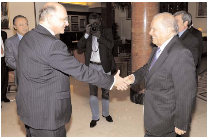
El Canciller argentino, Héctor Timerman, saluda al Secretario General Iberoamericano