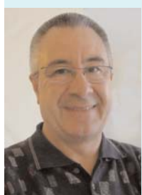
Salvador Arriola Secretario para la Cooperación Iberoamericana SEGIB

En el plano de formación y políticas públicas, se ha constituido el Comité Técnico y Ejecutivo del programa para el fortalecimiento de la Cooperación Horizontal Sur-Sur. Con este programa se pretende formar a los equipos de las dependencias de Cooperación, compartir buenas prácticas en la región y mejorar la calidad e impacto de sus acciones.