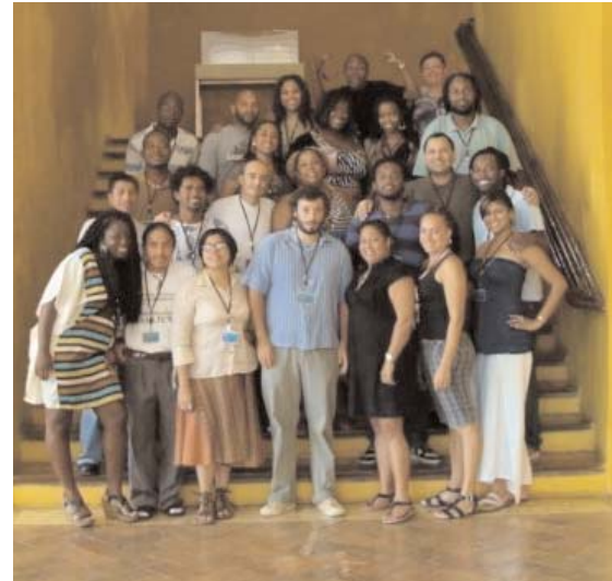
En la imagen, los participantes en el Seminario.