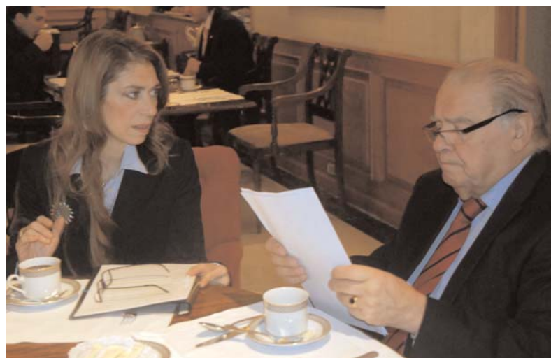
La Ministra de Industria de Argentina, Débora Giorgi, conversa con el Secretario General Iberoamericano durante la reunión que mantuvieron en Buenos Aires.

Asimismo, en noviembre, la ciudad de Buenos Aires acogerá el Seminario de Alto Nivel sobre Políticas Públicas para Pymes, organizado por Iberpyme. □