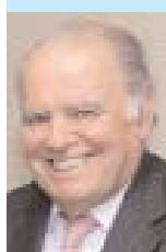
Enrique V. Iglesias Secretario General Iberoamericano