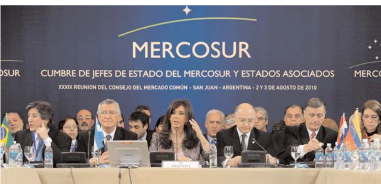
Intervención de la presidenta de Argentina, Cristina Fernández de Kirchner.

La Secretaría General Iberoamericana participó en las sesiones del Consejo del Mercado Común y de los Estados Asociados y en la Cumbre de Presidentes del MERCOSUR, realiza-