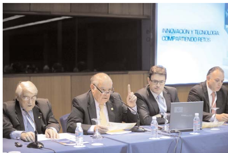
El Secretario General Iberoamericano preside la mesa durante la IV sesión plenaria de la Asamblea Parlamentaria Euro-Latinoamericana

LAT debería haberse celebrado en un país latinoamericano pero excepcionalmente, al reunirse el 18 de mayo la Cumbre UE-