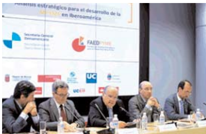
Presentación del Estudio "Análisis Estratégico para el Desarrollo de la MPYME en Iberoamérica."

El informe, realizado por la Fundación para el Análisis Estratégico y Desarrollo del Pequeña y Mediana Empresa (FAEDPYME) e impulsado por las Universidades de Cantabria, Murcia y Politécnica de Cartagena, revela que la innova-