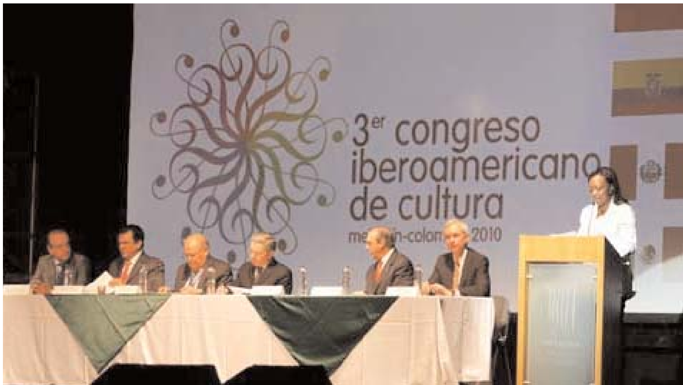
La ministra de Cultura de Colombia, Paula Marcela Moreno, durante su intervención en el acto de apertura del Congreso