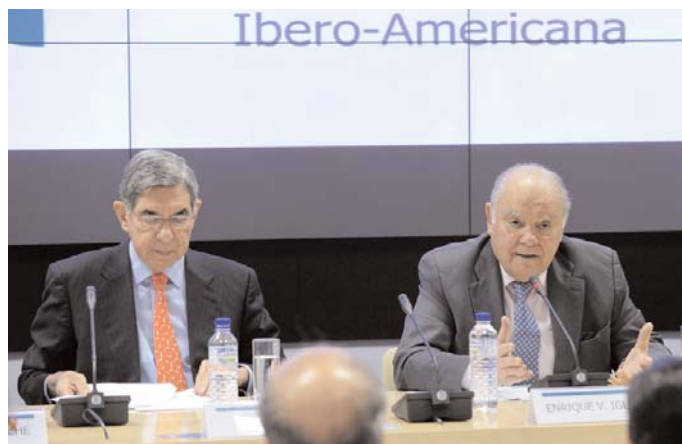
El ex presidente de Costa Rica, Oscar Arias, junto al Secretario General de la SEGIB

En el mensaje de Arias, que ofreció su particular punto de vista sobre la situación actual de América Latina y el Caribe, destacaron cuatro puntos