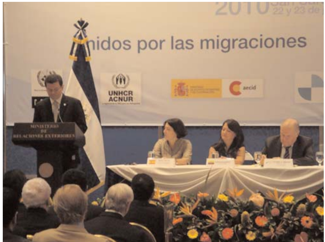
Sesión inaugural del II FIBEMYD, en San Salvador.

Durante la ceremonia de inauguración, presidida por el Presidente de la Comisión de Relaciones Exteriores de la Asamblea Legislativa de El Salvador, intervinieron el Ministro de Relaciones Exteriores de El Salvador, el Ministro de Relaciones Exteriores de Guatemala, la Ministra de la Secretaría Nacional del Migrante de Ecuador, la Secretaria de Estado de Inmigración y Emigración de España, la Comisionada del Instituto Nacional de Migración de México, en su calidad de Presidencia Pro-Tempore del FMMD y de la CRM, la Directora