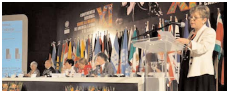
Una de las sesiones de la Conferencia celebrada en Brasil.

las nuevas tecnologías y promover medios de comunicación igualitarios, democráticos y no discriminatorios.