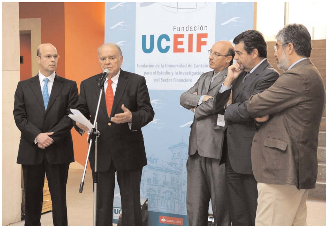
Declaraciones de Enrique V. Iglesias en la inauguración del III Encuentro SEGIB de Economistas.

selecto de economistas iberoamericanos mantenga un dialogo profundo y sincero sobre los retos con los que la región se enfrenta.