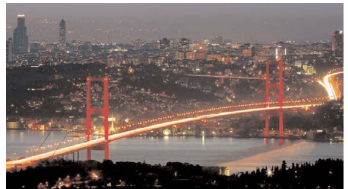
En Estambul, puente sobre el Bósforo, que une la orilla europea y la orilla asiática.

Para Enrique V. Iglesias, además de la respuesta económica, hay que enfrentar la crisis con valores y principios como los que representa la Alianza de Civilizaciones. En este II Foro han intervenido, entre otros, líderes