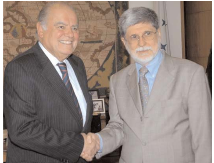
El ministro de Relaciones Exteriores de Brasil, Celso Amorim, saluda a Enrique V. Iglesias

Iglesias señaló que con Amorim también discutieron aspectos de la XIX