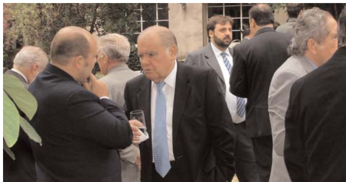
Un momento del animado encuentro con los medios de comunicación uruguayos

Asimismo, se abordaron la actividad de la SEGIB y de la