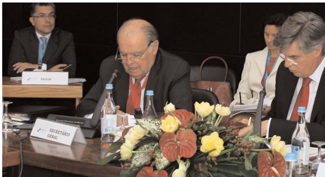
Enrique V. Iglesias y Jose António Pinto Ribeiro, ministro portugués de Cultura