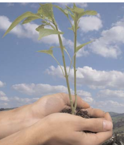
Viene de la página 1

Siempre ha sido así. Saldremos de la crisis y, como en anteriores ocasiones, saldremos mejor.