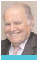
Enrique V. Iglesias Secretario General Iberoamericano

Si algo caracteriza nuestro mundo actual es una gran ambivalencia y una creciente inseguridad. Ambivalencia que surge, por un lado, de los grandes progresos de la humanidad en las últimas décadas y, por otro, de los grandes déficits políticos y sociales no resueltos.