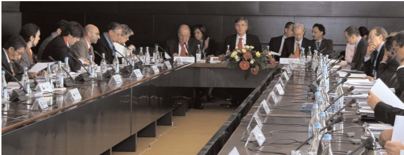
Sesión de trabajo de la XII Conferencia de ministros de Cultura iberoamericanos

Los ministros iberoamericanos de Cultura decidieron, el 22 de abril en Lisboa, impulsar la difusión del español y el portugués en Internet y en el mundo de la ciencia y la tecnología