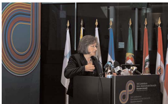
La ministra de educación portuguesa, María Lourdes Rodrigues

Para llevarlo a cabo la ministra consideró fundamentales los fondos de cooperación establecidos a nivel iberoa-